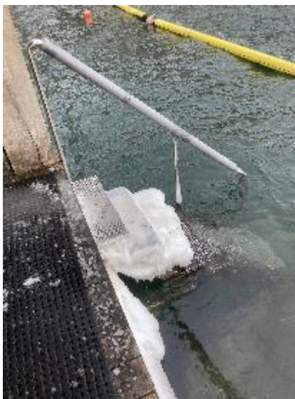
Tilisning her til morgen

Der er blevet indkøbt værktøj til at fjerne is – og nu ser trappen så fin ud, takket været nogle friske vinterbadere her til formiddag. Værktøj til fjernelse af is ligger ved siden af nedgangen til vandet.