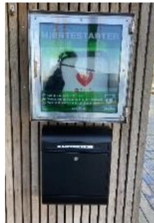
Ny placering af postkassen til bl.a. nøglearmbånd