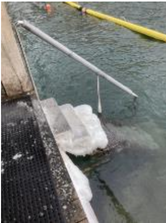
Isolering af gelænder ved nedgang til vandet

Husk at Nordhavn IF har lejeaftalen med Københavns Kommune for indendørsfaciliteterne mens det er Københavns Kommune som er ejer og også står for al udvendig vedligeholdelse etc.