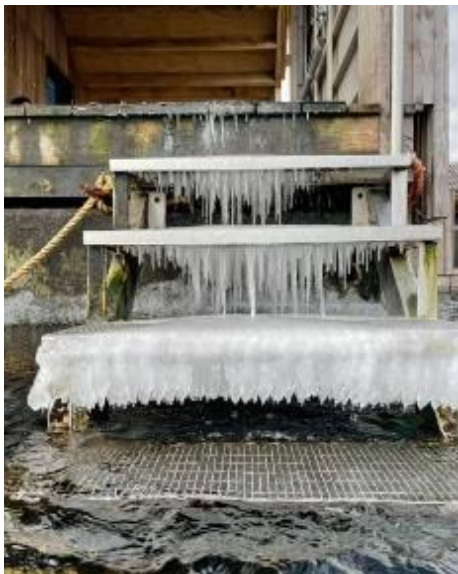
Trappen forleden dag, da frosten satte ind

Pas ekstra på nu med frosten i vejret. Trappen fryser til og vandtermometer er lukket inde i is.