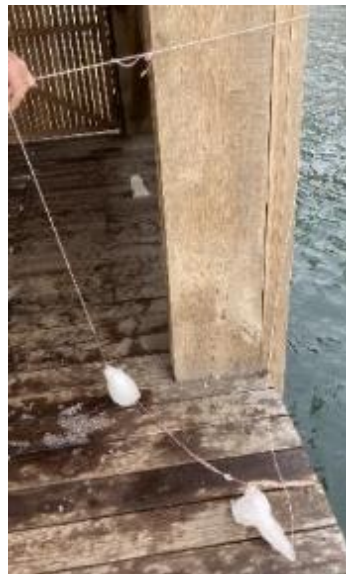
De manuelle vandtermometre er skjult i isklumper.