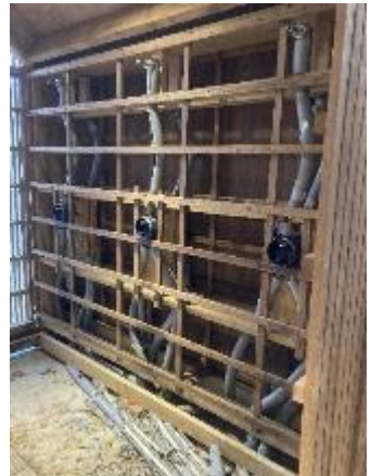
Dameomklædningens bruseområde. Håber renoveringen ikke tager måneder.