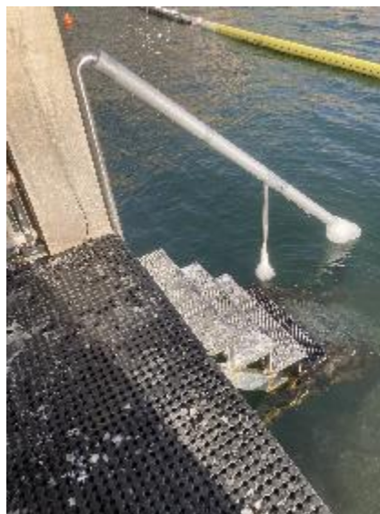
Så er trappen isfri igen, tusind tak