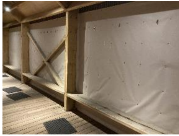
Afskærmning i herreomklædningen for vind og regn mod vest.