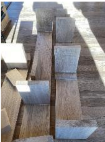
De nye udendørsbænke er samlet, men skal ligge til tørre et par dage endnu